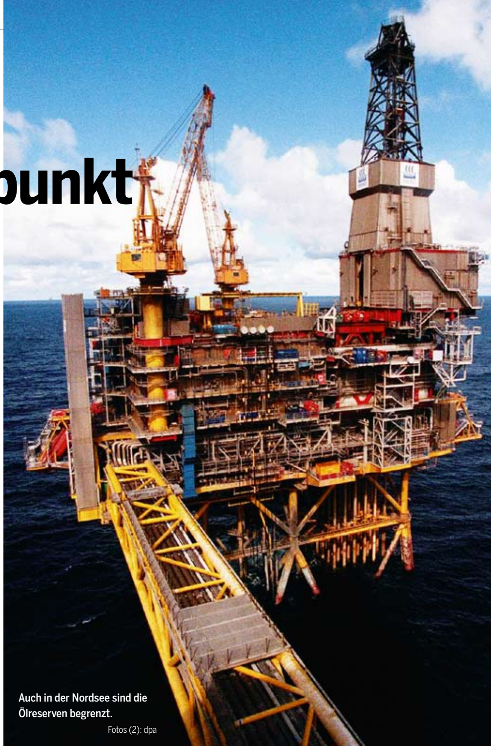
Auch in der Nordsee sind die Ölreserven begrenzt.

Selbst die Internationale Energie Agentur (IEA), als Regierungsorganisation die Interessenvertretung der 28 Hauptverbraucherländer und bisher eher Berufsoptimist in Sachen Energiesicherheit, warnt vor dramatischer Verknappung und fordert eine radikale Wende in der Energiepolitik. Denn in der aktuellen Wirtschaftskrise fahren die Ölfirmen ihre Investitionen zurück. Nobuo Tanaka, Chef der IEA, warnte in der Süddeutschen Zeitung : „Wenn die Nachfrage wieder anzieht, könnte es zu einem Versorgungsengpass kommen. Wir prophezeien sogar, dass dieser Engpass 2013 eintreten könnte.“ Laut IEA würde der Ölpreis dann den Höchststand vom Sommer 2008 noch übertreffen und bis zu 200 Dollar pro Barrel erreichen.