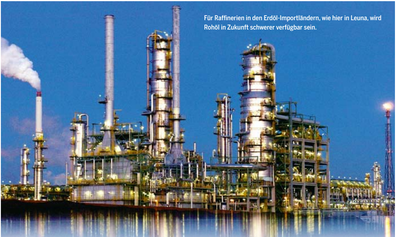
Für Raffinerien in den Erdöl-Importländern, wie hier in Leuna, wird Rohöl in Zukunft schwerer verfügbar sein.

mehr zu erwarten. Selbst die Erschließung ökologisch und technologisch problematischer Lagerstätten wie die der Arktis oder kanadischer Ölsande werden den Abwärtstrend nicht stoppen können.